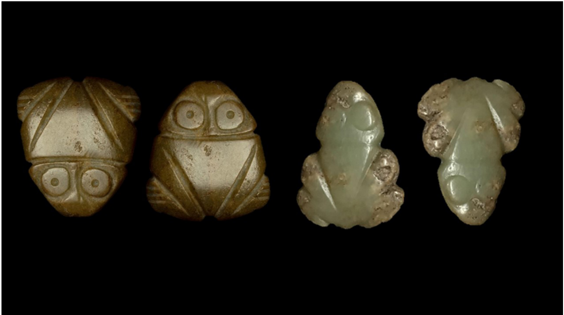
Figura 1. Muiraquitãs antropozoomorfos manufacturados sobre suportes de pedra verde.