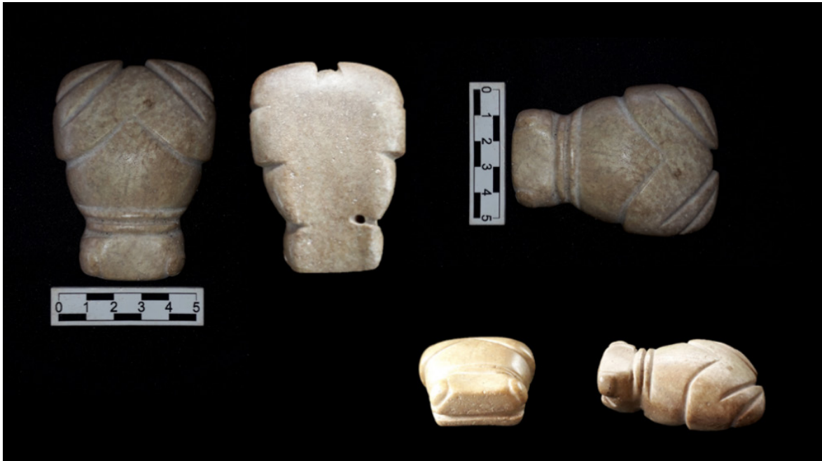
Figura 5. Muiraquitã antropozoomorfo de tamanho incomum (7cm), recuperado nas proximidades do rio Iriri, um afluente da margem esquerda do rio Xingu. Um segundo exemplar com as mesmas proporções, matéria prima e cadeias operatórias de produção correlatas, foi encontrado no município de Belterra, e está na coleção do Museu Paraense Emílio Goeldi.