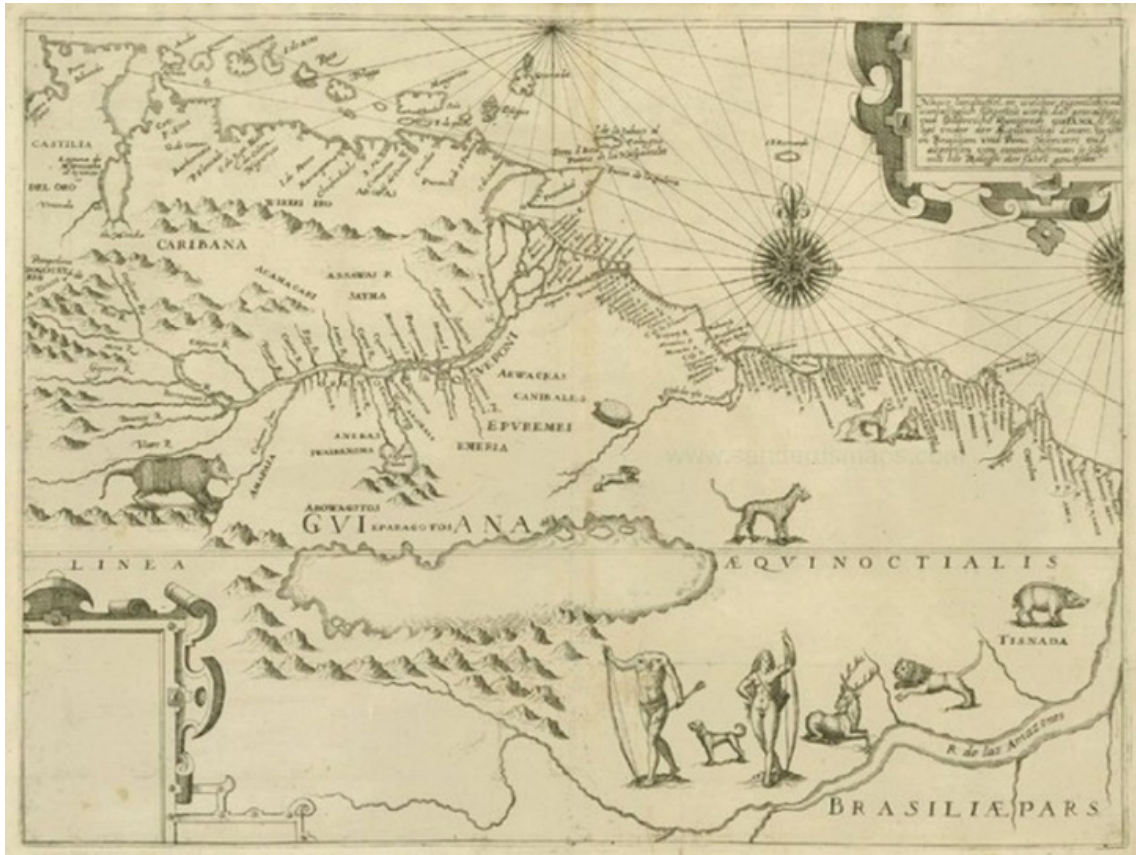
Figura 2. O imaginário europeu da perspectiva indígena, tendo na região do Baixo Amazonas representada a figura da Icamiaba. Mapa de Theodore de Bry, de 1599.