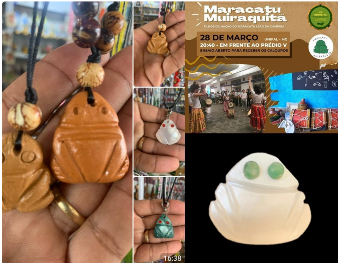
Figura 6. Muiraquitãs de cerâmica e conchas comercializados na cidade de Santarém, grupo maracatu muiraquitã de Minas Gerais e muiraquitã de arqueologia experimental, elaborado sobre suportes de concha e jadeíta.