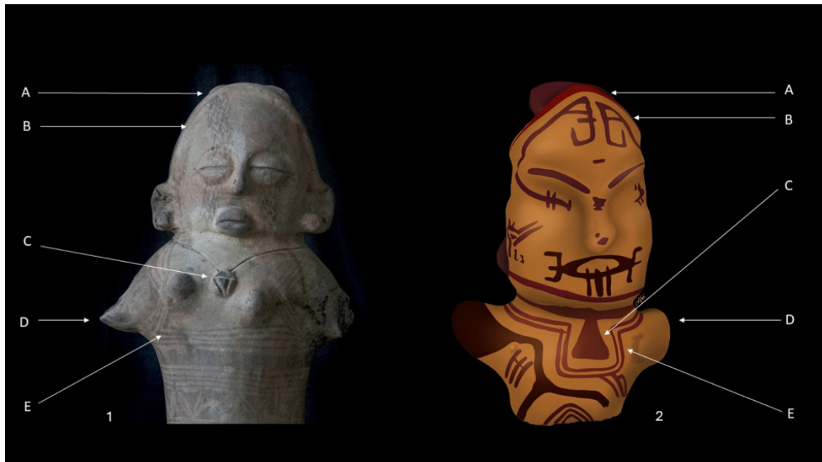
Figura 4. Pontos de convergência cultural estética e cerimonial entre estatuetas Konduri (1) e Marajó (2). A: pente, B: tiara e corte de cabelo, C: muiraquitã, D: braços atrofiados, E: campo decorativo da pintura corporal.

Fonte: © Cristina de Martini, © Museu Nacional vetorizada por Mayara Sá.