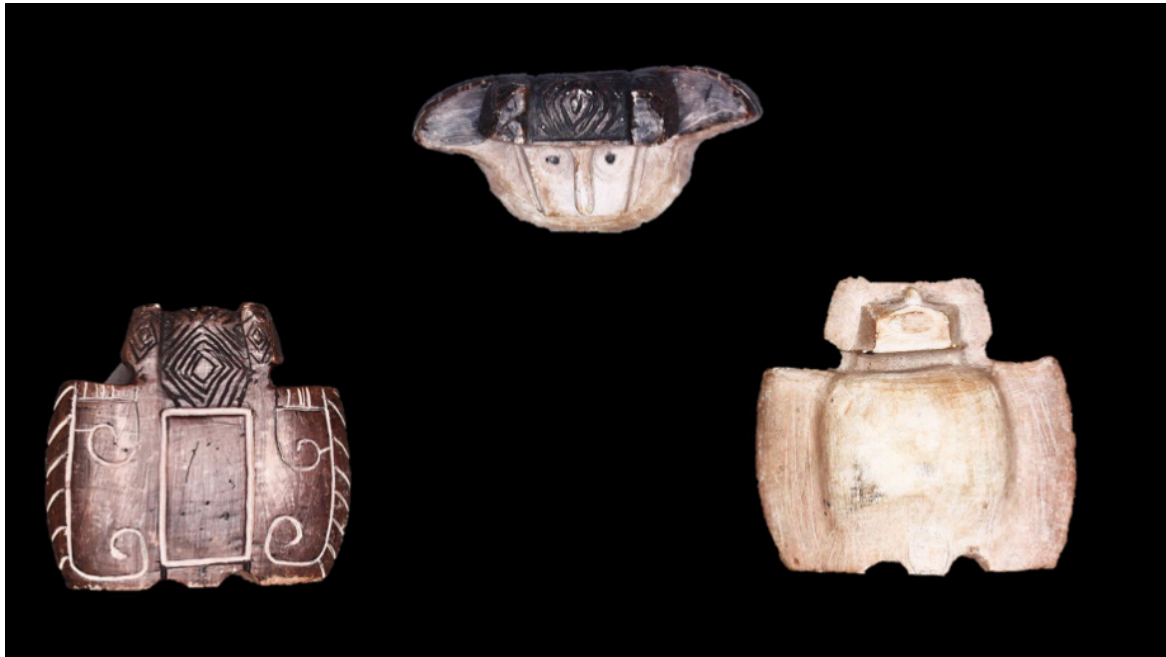
Figura 9. Estatueta lítica zooantropomorfa de morcego alado/humano, coletada por Curt Nimuendajú no início do século XX entre grupos do Alto Trombetas, que ainda dominavam as cadeias operatórias de produção lítica desses objetos.