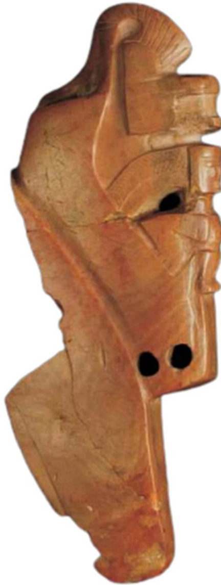
Figura 7. Provável representação da cobra mãe dos muiraquitã, tendo uma Icamiaba agarrada ao corpo da Boiuna.