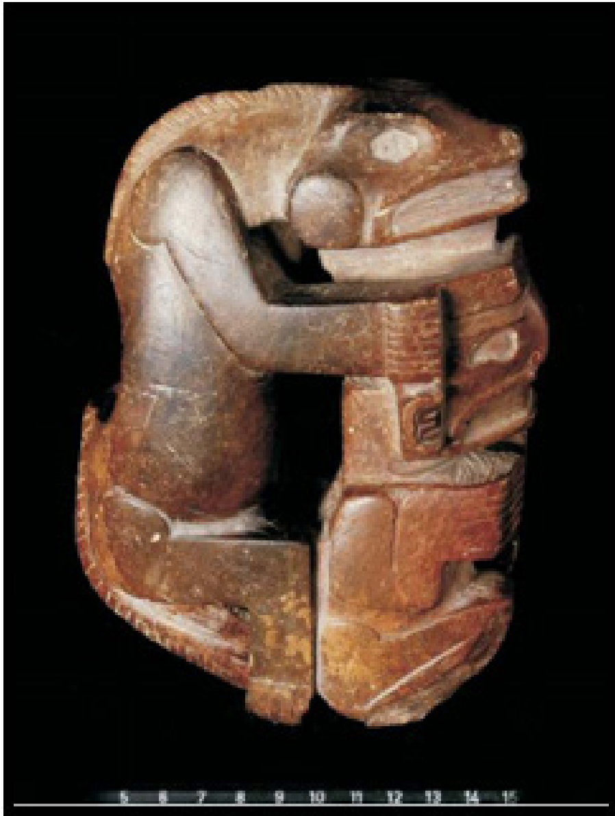
Figura 3. Ídolo de pedra ou vaso de beber de aspecto tridimensional representando homem agachado, em provável transe, sustentado por seu alter ego sáurio, sentado em um tamborete, imbricado de peixe e ave de rapina. Oriundo da região de Óbidos/PA.