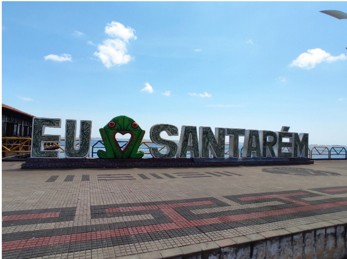
Figura 11. Orla da cidade de Santarém, que se utiliza fartamente da figura do muiraquitã como herança cultural tapajônica

Santarém, área de convergência e irradiação cultural em tempos pretéritos e atuais, funciona como um dos centros de produção e dispersão de muiraquitã em períodos pré-coloniais e atuais no Baixo Amazonas, hodiernamente se utiliza a imagem e nome do muiraquitã como um veículo propagador de sua herança cultural milenar, inserindo o termo e representações formais do objeto no cotidiano regional e nacional.