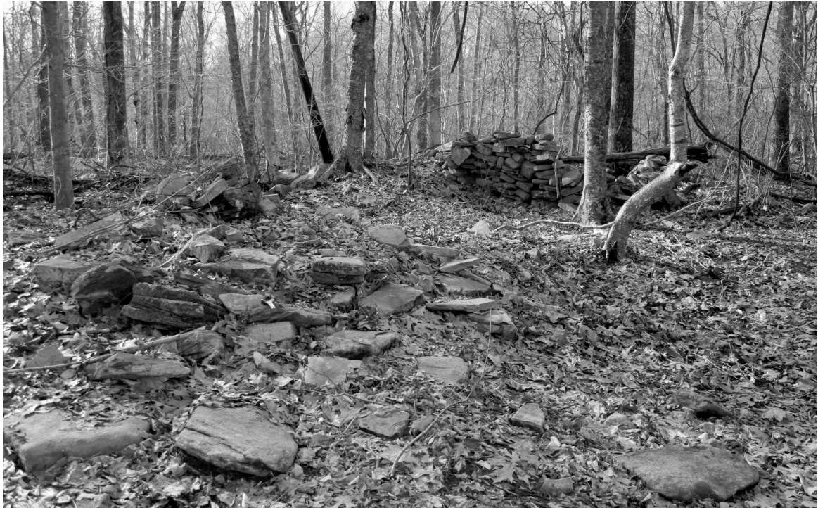
Figura 3. Vista do Sítio 102-123, escavado em 2005 e 2006. A pilha de pedras em primeiro plano corresponde à chaminé desmoronada de uma casa de estrutura em madeira, e a leve depressão à direita é o porão preenchido que ficava sob essa casa. As pedras empilhadas ao fundo formam o pequeno recinto de muro de pedra que pode ter servido como fundação para um celeiro.