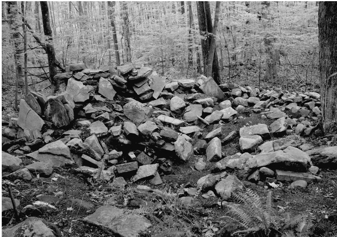
Figura 4. Vista do Sítio 102-113, escavado em 2004. A grande pilha de pedras representa uma chaminé desmoronada, e a concavidade delimitada e parcialmente preenchida por essas pedras corresponde ao espaço rasteiro que existia sob a casa. O depósito de lixo mencionado no texto foi encontrado logo fora do enquadramento da fotografia, à esquerda.

As cerâmicas variam desde estilos de meados do século XVIII, como white salt-glazed stoneware , slip ware , a cerâmicas mais comuns no último quarto do século, como creamware , early pearlware , english brown stoneware e porcelana chinesa (Silliman; Witt, 2010; Witt, 2007). A cerâmica vermelha era muito comum, assim como fragmentos de tigela e haste de cachimbo de argila plástica branca ( ball clay ), vidro de garrafa e fragmentos de chaleira de ferro. Vidro de janela, uma grande variedade de pregos cortados, pedras de soleira e pilhas de chaminés colapsadas revelam a presença de pelo menos uma estrutura de tábuas de madeira.