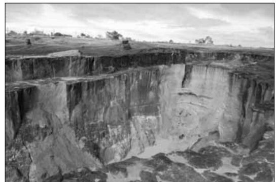
FIGURA 4: RECIPIENTE 10 EXUMADO NA ETAPA DE 2001 (NEVES & COSTA 2001) E VOÇOROCA ATUAL ABERTA NO SÍTIO EM 2010 (FOTO DE HELENA LIMA, TIRADA EM 2010).