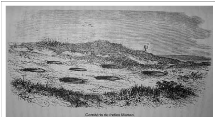
FIGURA 2 – URNAS AS FUNERÁRIAS AFLORANDO NAS PROXIMIDADES DO ATUAL CENTRO HISTÓRICO DE MANAUS, REPRESENTADAS POR PAUL MARCOY EM 1869 (FONTE: MARCOY P. 2001:165).