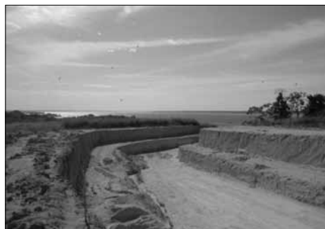
FIGURA 5: RECIPIENTES ENCONTRADOS EM 2006 NO SÍTIO LAJES, E VALA CRIADA PELAS OBRAS DE IMPLANTAÇÃO DE TUBOS PARA CAPTAÇÃO DE ÁGUA.