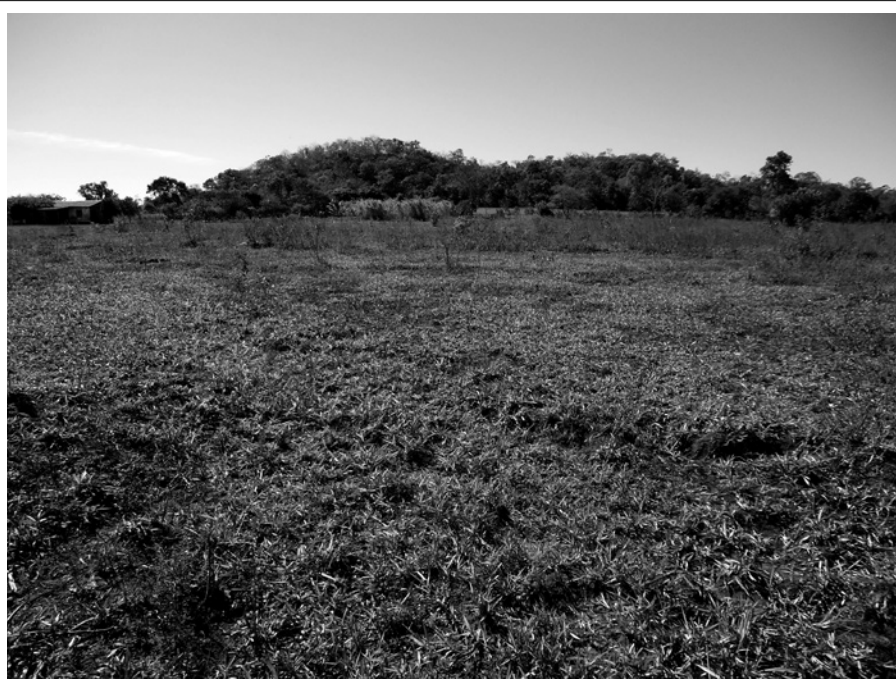
Figura 4: Potrero, retomada territorial na Terra Indígena Lalima.

Quanto aos significados desses conjuntos, inferi que os Guarani e os povos portadores da Fase Jacadigo poderiam ser compreendidos como populações agricultoras culturalmente distintas que se estabeleceram na região desde períodos pré-históricos. É importante citar que Schmitz et al.