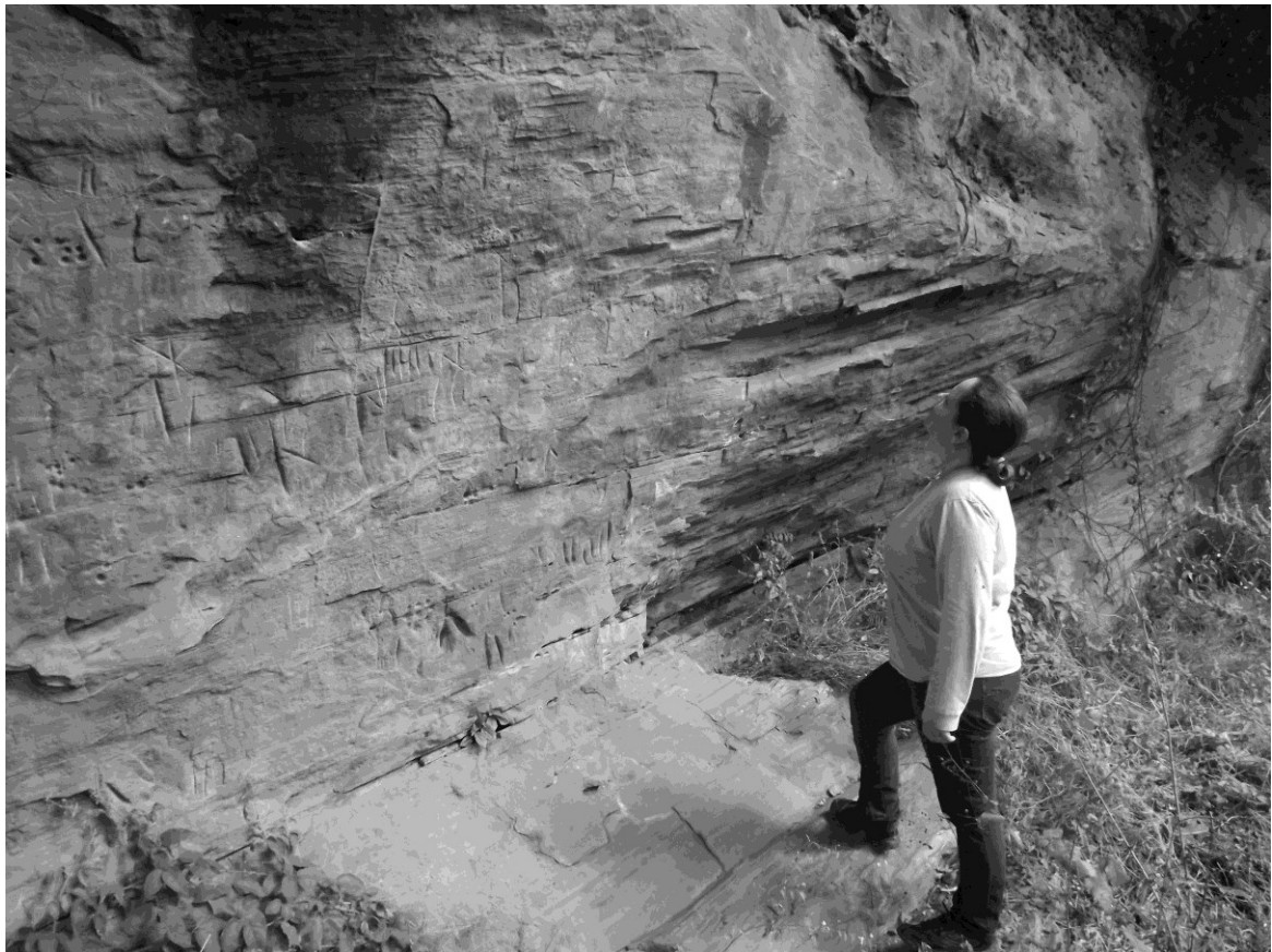
Figura 3: Sítio rupestre Morro do Trem.

O sítio Morro do Trem encontra-se acerca de 22 km da cidade de Piraju e de 21 km do sítio Fazenda Ibicatu. Ambos estão inseridos entre as represas das Usinas Hidrelétricas Chavantes e Armando Avellanal Laydner (Jurumirim). Portanto, mesmo antes da construção das UHEs, o acesso às drenagens menores e aos grandes rios, passíveis de navegação, era de boa qualidade, pois estão inseridos na Bacia do Rio Paranapanema. O sítio Morro do Trem é constituído por diversos registros gravados e pintados em painel de aproximadamente de 15 m de largura por 3 m de altura, enquanto o sítio Fazenda Ibicatu é constituído por única pintura em vermelho em paredão rochoso localizado em estrada de terra de fácil acesso por moradores.