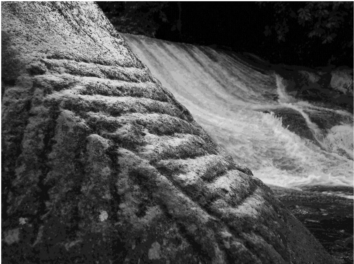
Figura 2: Sítio rupestre Pilões.

Na Província Costeira, na área do Parque Estadual da Serra do Mar, foi documentado pela Zanettini Arqueologia, durante as ações realizadas para a elaboração do Plano de Manejo do Parque, o primeiro sítio rupestre nesse contexto geomorfológico: o sítio Pilões. Segundo os arqueólogos Calippo e Zanettini (2006), Pedro Augusto Mentz Ribeiro, pioneiro arqueólogo da arqueologia brasileira, apontou que nas evidências registradas no Sítio Pilões não podem ser identificadas marcas características de picoteamento e/ou alisamento típicos do período pré-colonial, mas que as marcas identificadas indicam terem sido produzidos por um instrumento não lítico, podendo ser até um instrumento de metal que apenas estariam de posse das populações locais, a partir da chegada do colonizador europeu.