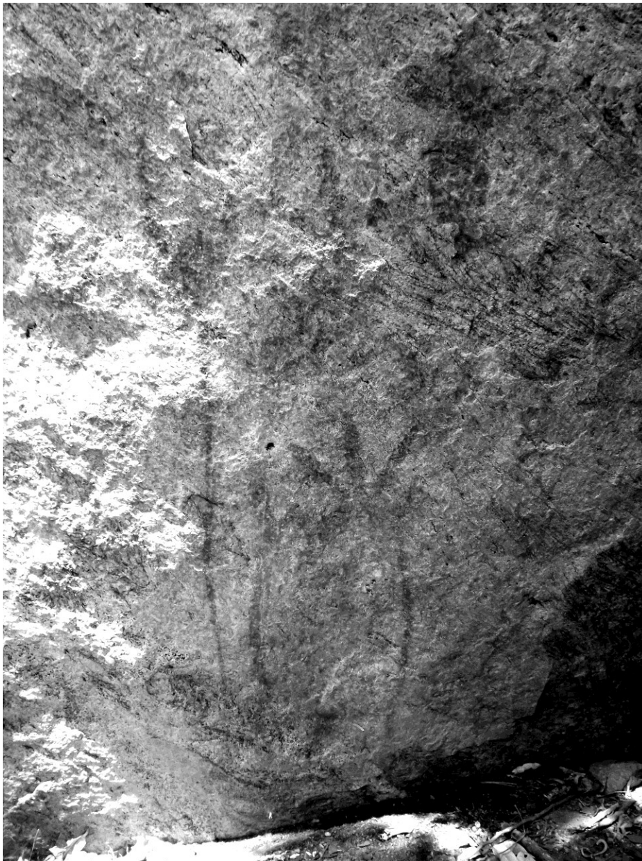
Figura 5: Sítio Rupestre São Joaquim.

Assim, a história local se inicia com a colonização, sendo o nome do município atribuído à Casa Bragança, dinastia reinante em Portugal em meados de 1640, ou ainda, a um português de nome Bragança, que era dono de um rancho para abrigar tropeiros.