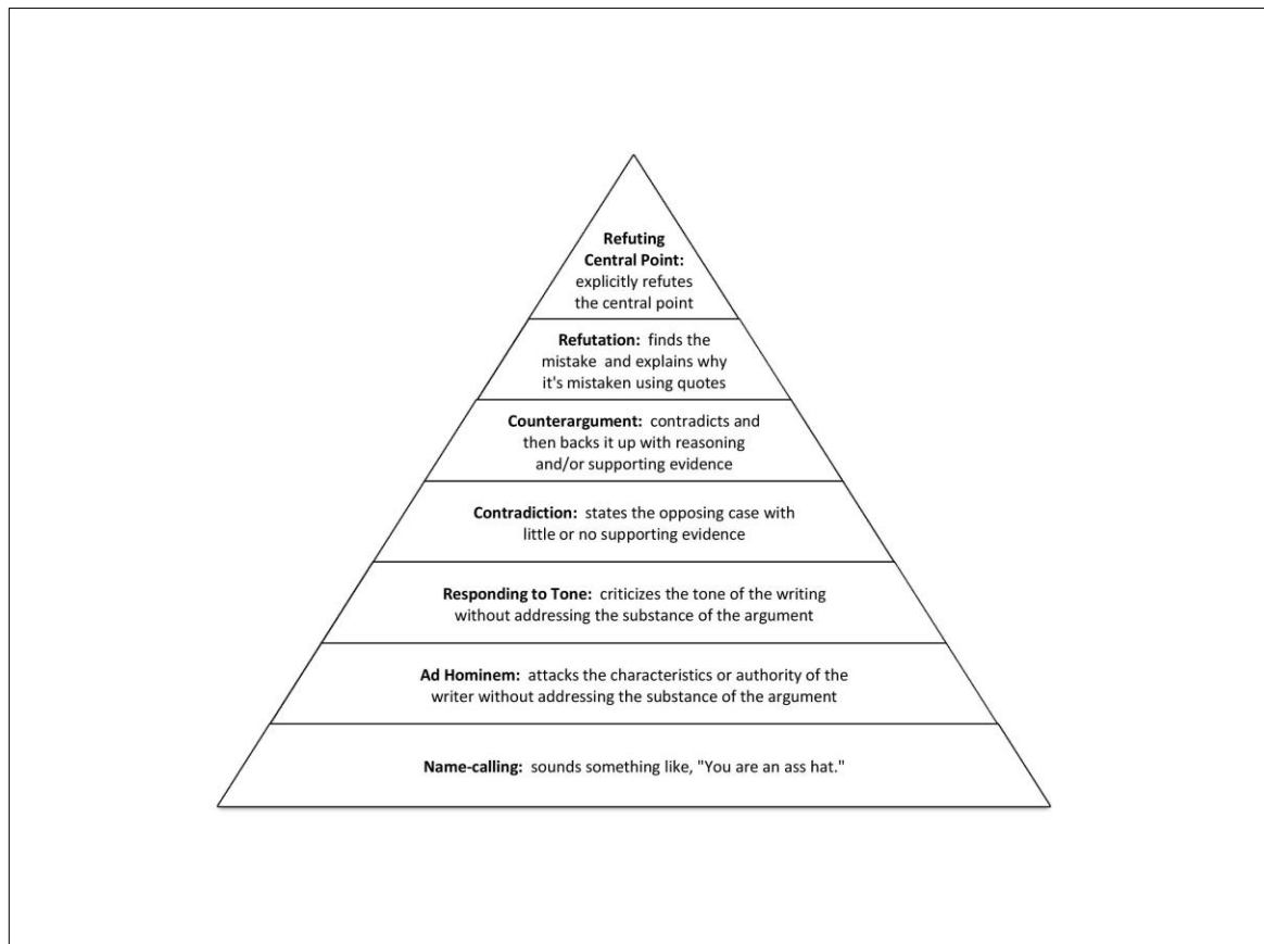
Figura 1 - A "hierarquia de desacordo" de Paul Graham que ilustra o significado de diferentes tipos de respostas, que vão desde as injuriosas (abaixo) até a refutação do ponto central de um argumento (acima). Só os três primeiros de cima constituem contra-argumento e refutação. Fonte: Graham (2008) e Rocket (2008).

Se o negócio da arqueologia é o presente, o presente também é o negócio do Estado e do capitalismo moderno tardio. Neste ensaio desconstruímos as relações entre três eventos diretamente relacionados com projetos de “desvelar” a arqueologia (GNECCO & DIAS, neste volume). Os três eventos que nos interessam são: 1) a publicação do artigo Commercial Archaeology in British Columbia (LA SALLE & HUTCHINGS, 2012); 2) o anúncio do Intercongresso da WAC em Porto Alegre em 2013 (GNECCO & DIAS, 2013); e 3) nossa participação no Congresso Anual da Associação de Arqueologia do Canadá em 2013 (HUTCHINGS, 2013; LA SALLE, 2014). O que os três eventos têm em comum, além de nossa participação, é a sua relação com o negócio da arqueologia. Para analisar as reações a estes três eventos empregamos o esquema de classificação desenvolvido por Paul Graham (2008), ilustrado na figura 1.