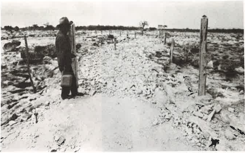
Foto 5 - Cerca delimitatória da entrada da área das Araras. Vê-se ainda o serviço de calçamento do acesso a trilha turística, executado com blocos recolhidos na superfície do Lajedo.