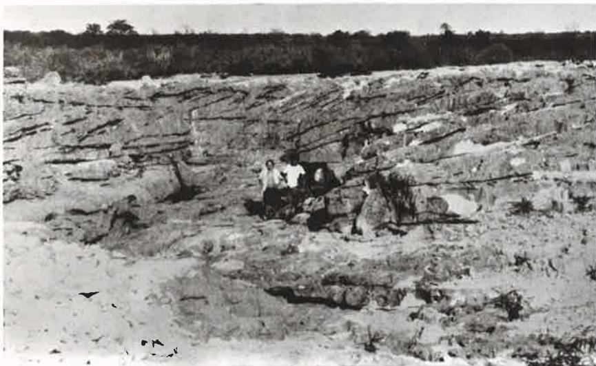
Foto 4 - Barra carbonática exumada, exibindo estruturas sedimentares. Em primeiro plano vêm-se blocos de calcário oriundos da lavra para fabricação de cal.