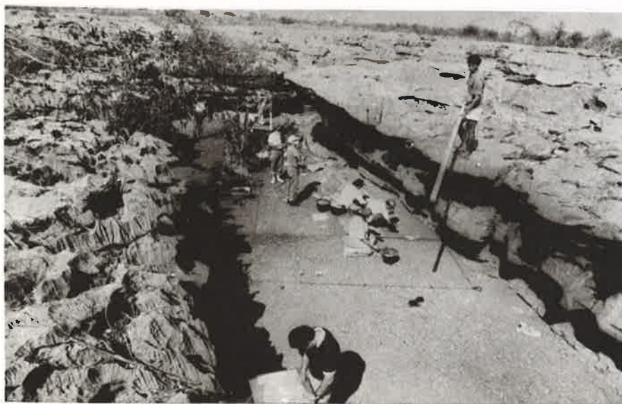
Foto 8: Equipe de arqueologia realizando escavações junto a abrigos com pinturas.