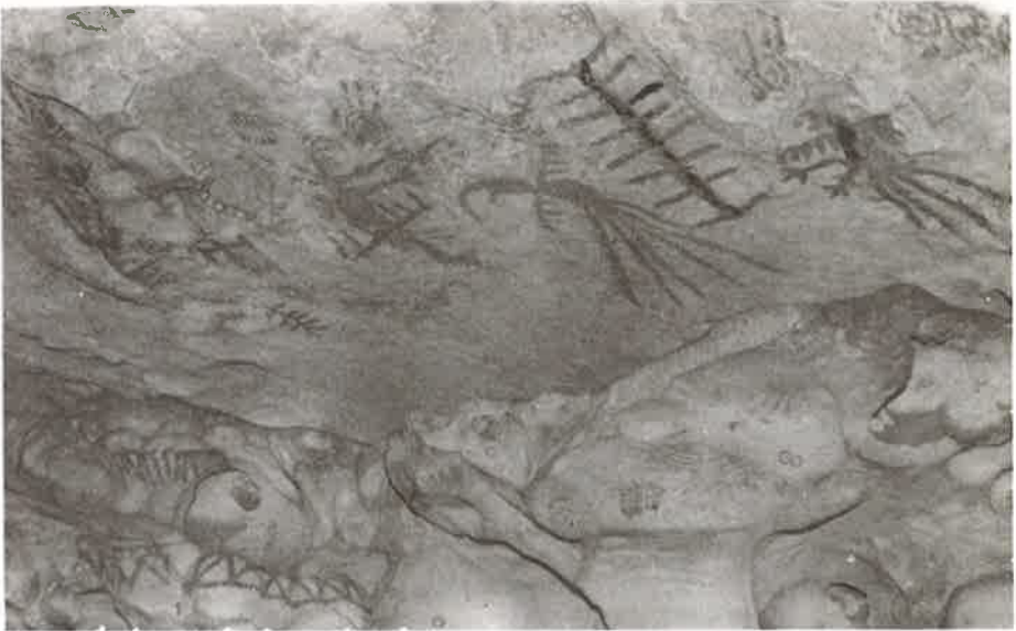
Foto 2 - Painel com pinturas rupestres executadas no teto do Abrigo das Araras.