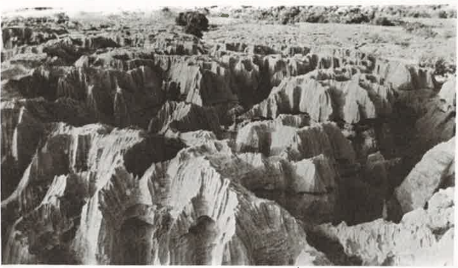
Foto 1 - Aspecto ruíniforme da superfície do Lajedo de Soledade