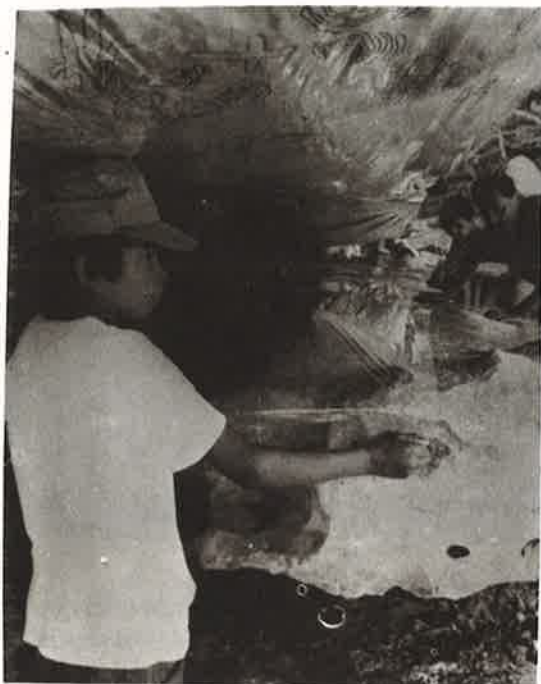
Foto 7: Equipe de arqueologia fazendo decalques das pinturas rupestres.