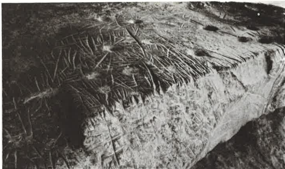
Foto 3 - Gravuras executadas em piso elevado de abrigo-sob-rocha na área do Olho d'Água.