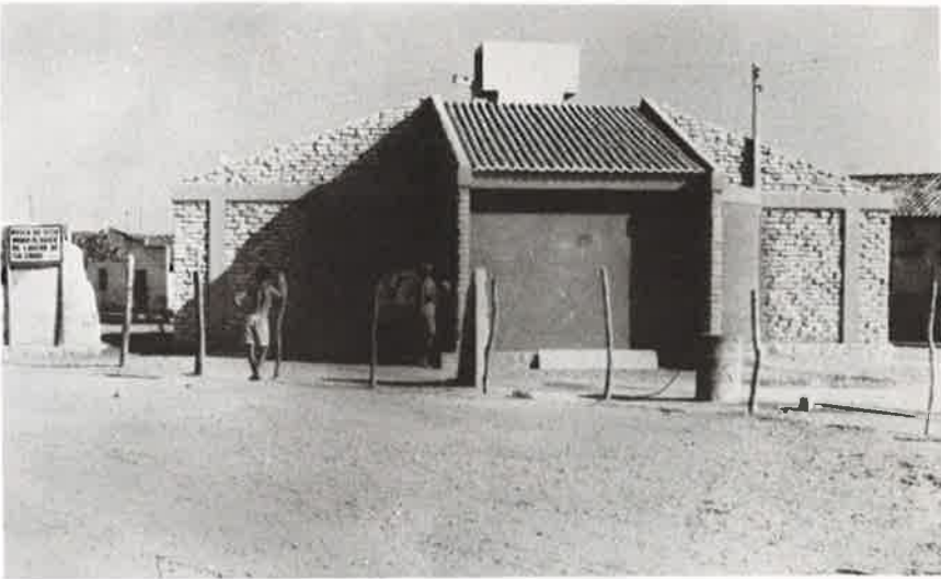
Foto 6: Museu/Centro de Visitação Turística da FALS, sendo construído na praça principal da Vila de Soledade.