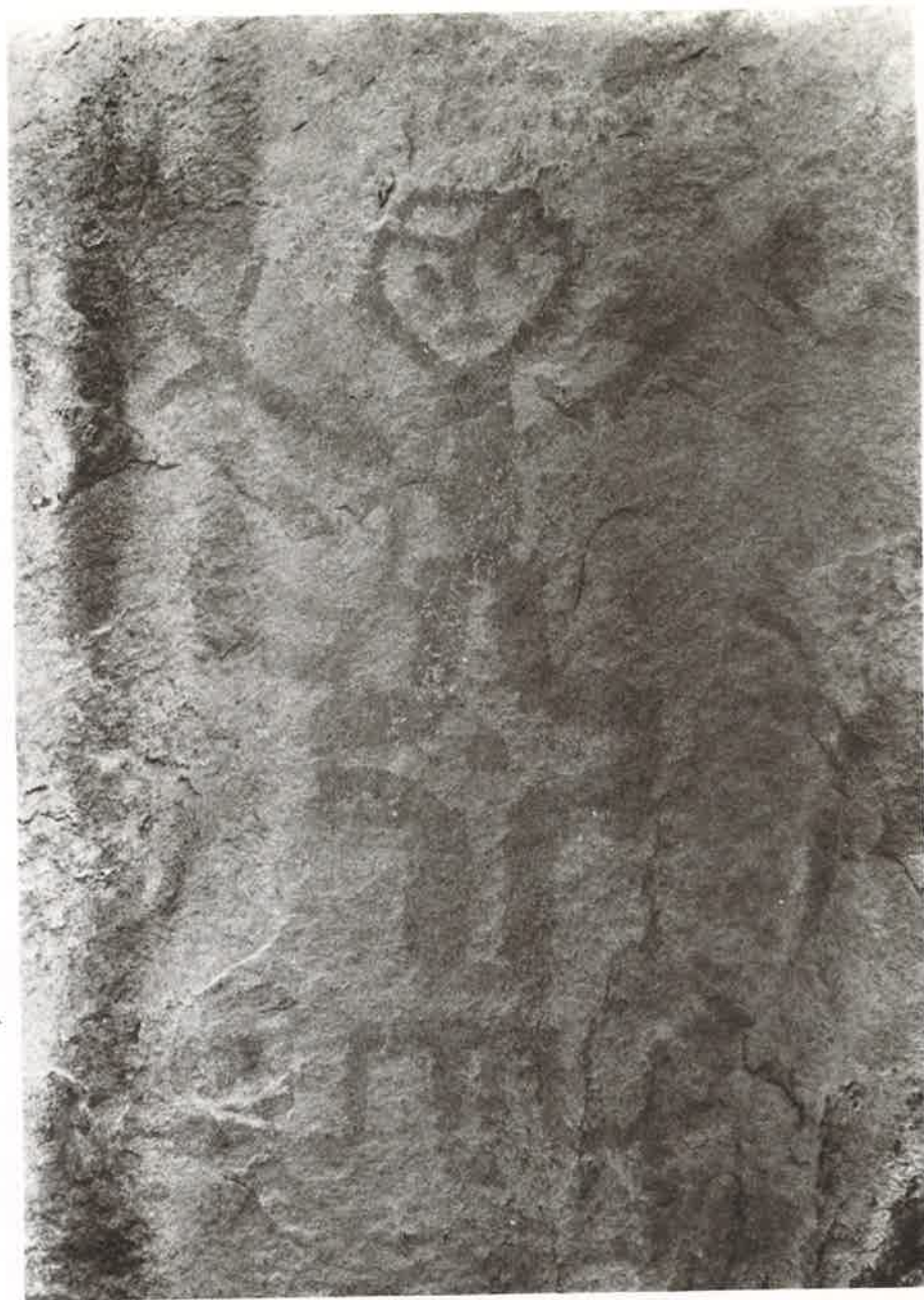
Foto 1 — Figura antropomorfa pertencente a hipotética Tradição Monte Alegre de Pinturas Rupestres. Sítio PA-MT-13: Serra do Sol. Município de Monte Alegre (PA)