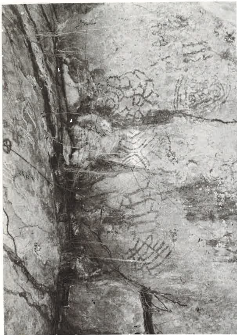
Foto 2 — Vista geral de um painel com figuras pertencentes a hipotética Tradição Alenquer de pinturas rupestres. Observa-se figuras antropomorfas de “mãos dadas”, grafismos bastante elaborados e figuras zoomorfas. Sítio PA-OB-5: Casas de Pedras. Município de Alenquer (PA).