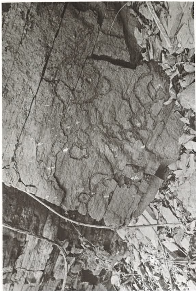
Foto 4 — Vista geral de um painel com gravuras rupestres pertencentes a hipotética Tradição Amazônia. Des- taque para a figura zoomorfa localizada a esquerda da rocha. Sítio PA-MT-11: Cachoeira Miura. Município de Monte Alegre (PA).