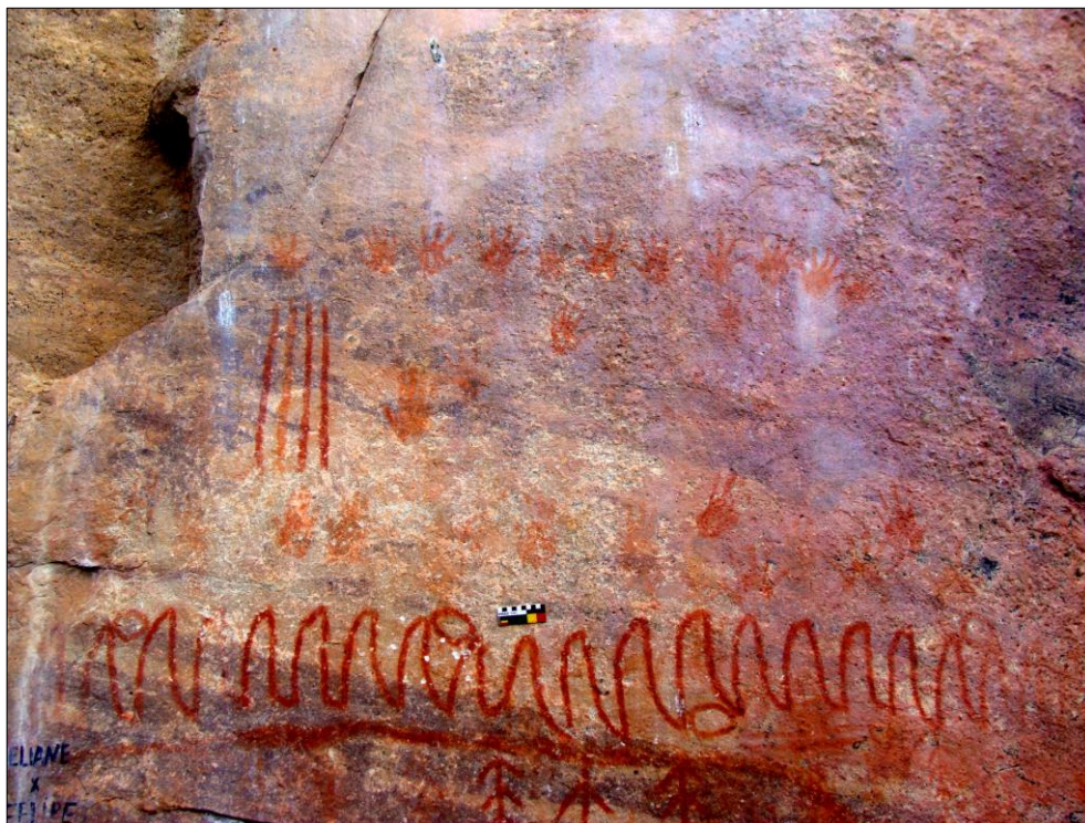
Figura 4 - Posicionamento e alinhamento paralelo de mãos carimbadas.

Ainda não realizamos intervenções em subsuperfície para identificarmos a existência de solo arqueológico, e, deste modo, podermos nos aproximar da real mensuração altimétrica deste solo até o posicionamento das mãos carimbadas. No entanto não há nenhum indício geológico que possa ter ocorrido nesse local onde tenha havido remoção considerável de sedimento na base da rocha e que implicasse numa depressão acentuada do solo atual e, porventura, do solo arqueológico.