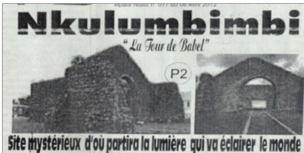
Figura 7 - “Site mysterieux dou partira la lumiere qui va éclairer le monde”.

O lugar carrega em si essa mancha, que não permite que haja prosperidade para o povo. Podemos pensar que existe no lugar um caminho que se liberado permitirá o povo kongo (africano) a reencontrar com a sua essência, ou seja, a restauração da ordem ancestral. E a cidade, ou melhor, a paisagem ideativa de Mbanza Kongo, é ponto central nesse pensamento, sendo a intersecção entre o retorno ao passado para guiar o futuro. O lugar é assim a intersecção entre o mundo e a paisagem de Mbanza Kongo. Neste aspecto, o papel de Kimbangu como chefe espiritual é o de mediar essa relação, o lugar do Ntotila dentro da paisagem. Não é qualquer um que pode mediar essa situação, é preciso que seja alguém legítimo, reconhecido, respeitado e poderoso o suficiente para exercer tal ação, o que os membros da Igreja reconhecem na pessoa de Simão Kimbangu Kiangani, ele mesmo um ser divino por ser a encarnação do Espírito Santo.