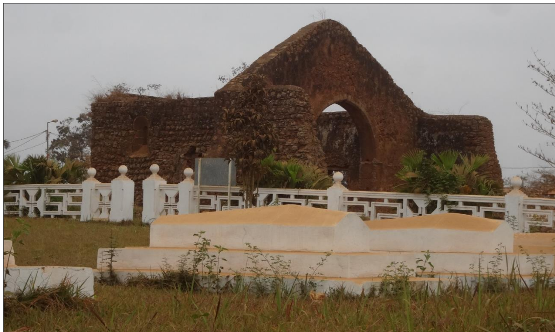
Figura 3 - O lugar Kulumbimbi, compreendendo as ruínas atribuídas a antiga Sé Catedral de São Salvador do Congo e os túmulos de alguns reis do Kongo. Mbanza Kongo, 09/09/2014.

Esse pensamento é compartilhado pela ex-ministra da Cultura de Angola, Rosa Cruz e Silva, que entende como principal patrimônio de Mbanza Kongo o seu papel dentro do império português: