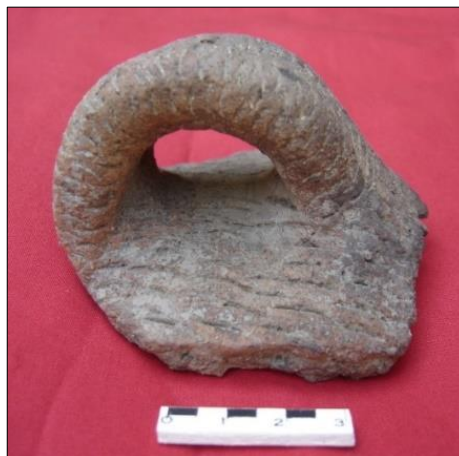
Figura 7 – Fragmento de corpo com alça ungulada.