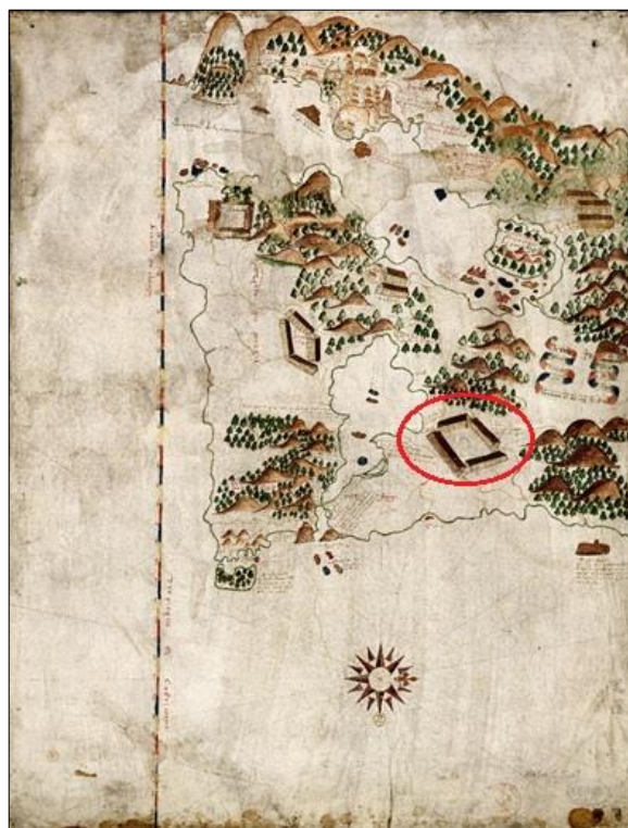
Figura 1 - Jacques de Vau de Claye “Le vrai pourtraict de Geneure et du Cap de Frie”, BNF - Res. Ge C 5007.

Ainda em 1579, o cartógrafo Jacques de Vau de Claye, também de Dieppe, registra grande quantidade de “escalles de trafic” em sua representação da laguna de Araruama. No “Le vrai pourtraict de Geneure et du Cap de Frie” (Figura 1), todos os pontos de desembarque, indicações dos melhores pontos de aguada, pescarias e trilhas estão descritos (CLAY, 1579). Uma dessas escalas é denominada “Lescalle de Paratitou”, na qual se encontra “La Village de Mauvais Garson”, uma aldeia também chamada Syrizi.