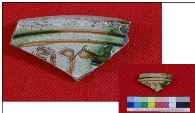
Figura 6 – Fragmento de prato. Procedência: Beauvais.

“Instabilidade, precariedade, provisoriedade” (NOVAIS, 1997: 32) resumem todas as sensações estruturais que definem, em profundidade, a vida cotidiana na América Portuguesa durante o século XVI. As relações cotidianas eram norteadas por esse trinômio. A teia de relações estabelecidas entre franceses e nativos não permitia que nenhuma relação estável fosse construída. O trato era de exploração, e a precariedade a reboque declara que tudo é provisório. Laura Mello e Souza (1997: 46), reportando-se aos primeiros registros dos sertanistas de Piratininga, periodiza o contato em três momentos: num primeiro, em que longe da Europa, adotam hábitos das populações nativas da região; em um segundo, “começam a desenvolver hábitos compósitos” e, no terceiro momento, então, “ocorre a adoção de hábitos europeus”. Parece certo que a presença de franceses no Serrano corresponda ao primeiro momento. Além dele, talvez o sítio Barba Couto, localizado na mesma região e ainda em estudos, seja datado relativamente desse período. Nele não temos também indícios de perda nos modos de vida nativos tradicionais (BUARQUE, 2009).