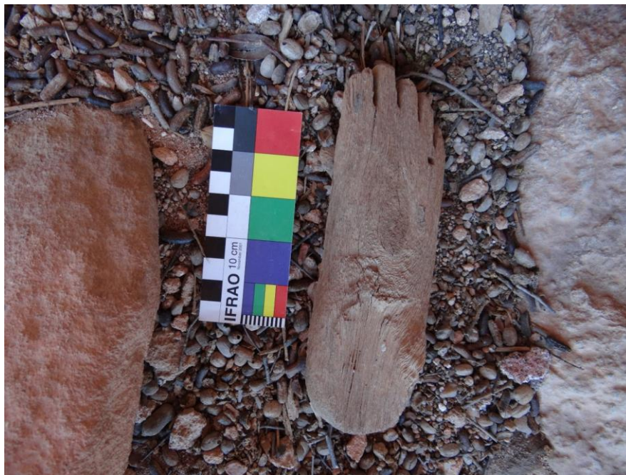
Figura 02. Pé 1, com furo simbolizando a enfermidade. Fonte: (SOUSA, 2019, p. 48).

comum na área e de fácil manuseio para o processo de entalhe, pois possui baixa densidade e dureza.