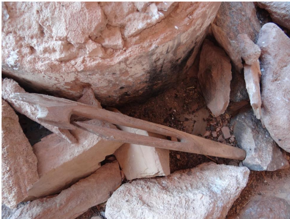
Figura 14. Muleta esculpida e lixada.

Muleta: O objeto (Figura 14) possui 80 cm de comprimento por 5 cm de espessura, feito de madeira de Amburana esculpida e lixada; percebe-se que houve uma avaria na parte central do artefato.