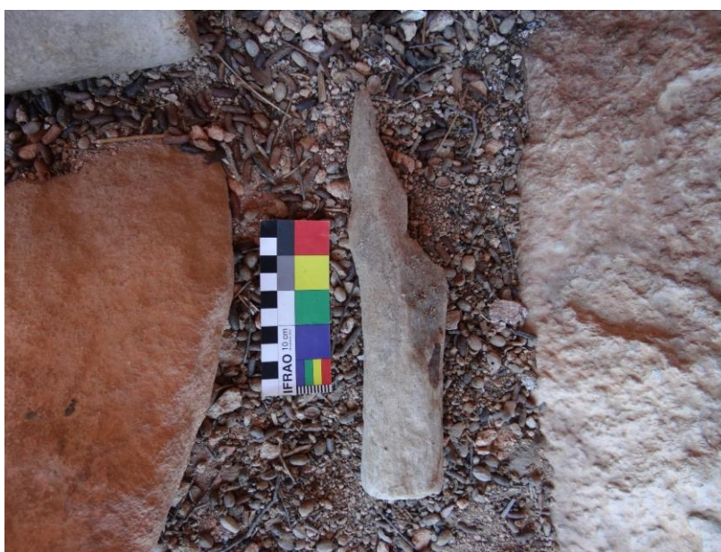
Figura 19. Ex-voto não identificado, objeto quebrado. Fonte: (SOUSA, 2019, p. 60).

Outro fator observado que pode ter promovido a degradação dos ex-votos é a ação antrópica. Os seis fragmentos evidenciados no sítio estavam quebrados (Figura 19), no entanto não foi possível, nesse primeiro momento, definir se as fraturas foram provocadas de forma intencional ou não. Contudo, como dito anteriormente, segundo as informações orais, alguns ex-votos foram quebrados e jogados para fora do abrigo por “jovens forasteiros” e posteriormente recolocados em seu lugar de origem pelos moradores locais, o que nos leva a supor que essas peças foram danificadas intencionalmente.