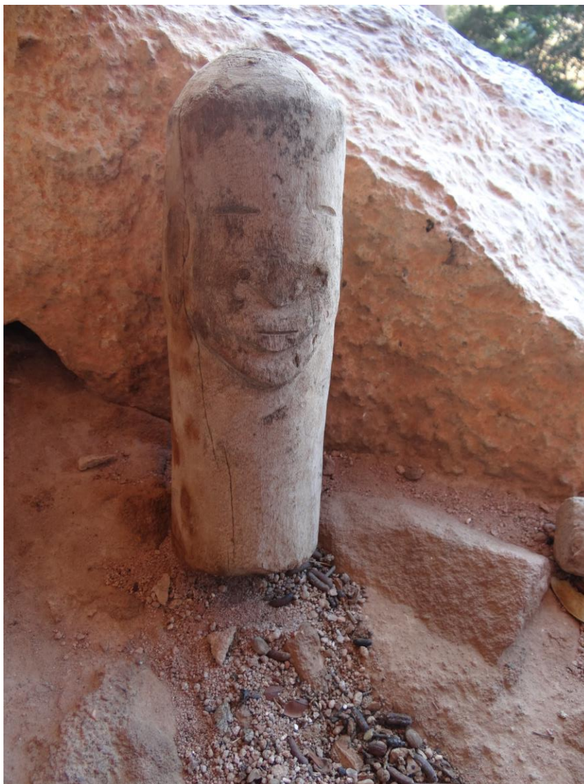
Figura 11. Cabeça com pescoço, representando o rosto, olhos e boca em baixo relevo; e o nariz, orelhas e queixo representado em alto relevo.

Cabeça com pescoço: Escultura entalhada e polida (Figura 11), tem 26 cm de comprimento por 8 cm de diâmetro; possui detalhes no rosto em baixo relevo, como os olhos e boca, e em alto relevo, como o nariz, orelhas e o queixo. Observa-se que o escultor aproveitou o formato naturalmente cilíndrico da madeira para modelar a peça, tendo sido empregado um tronco de Amburana.