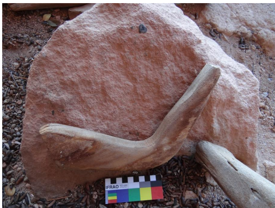
Figura 10. Braço sem a mão, com a parte do bíceps, cotovelo e pulso. Fonte: (SOUSA, 2019, p. 54).

Braço: Escultura entalhada de um braço sem a mão (Figura 10), tem 18 cm na parte do bíceps e 16 cm do cotovelo ao pulso. Podemos observar que o objeto foi lixado, e seu tipo de madeira é a Amburana.