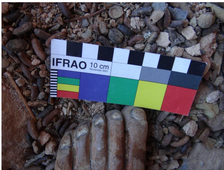
Figura 05. Pé 3, detalhe dos dedos anatômicos e das unhas pintadas. Fonte: (SOUSA, 2019, p. 50).