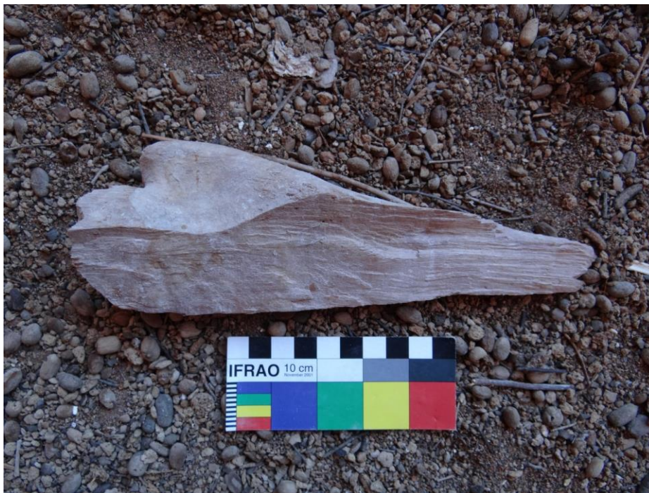
Figura 16: Mão quebrada e com furos de cupim. Fonte: (SOUSA, 2019, p. 61).

A madeira mole ou madeira macia é mais propícia a fungos, como é o caso da Amburana, que foi utilizada na maioria dos ex-votos. Já a madeira de Aroeira que foi utilizada na fabricação da cruz é uma madeira dura, pesada e mais resistente, até mesmo a cupins e apodrecimento. Contudo, pudemos observar nos raios que se desprenderam do cruzeiro (Figura 17) e que estão depositados diretamente no solo indícios de podridão-branca. Isto é, a peça “no início apresenta um aspecto piolhado por bolsas brancas na superfície da madeira. Os principais agentes são basideomicetos (...). Pouco a pouco as pequenas manchas brancas vão se juntando. A madeira perde peso e entra em colapso, porém de forma lenta” (GONZAGA, 2006, p. 51).