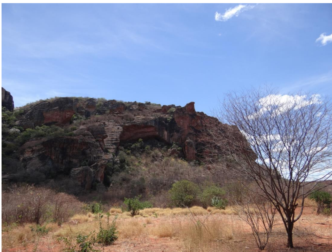
Figura 01. Sítio Arqueológico Toca do Cruzeiro.

O sítio arqueológico Toca do Cruzeiro (Figura 01) está inserido na comunidade Sítio do Mocó, no Município de Coronel José Dias/PI, estando localizado no entorno do Parque Nacional Serra da Capivara. Trata-se de um sítio multicompotencial, com presença de vestígios de fogueira, material vítreo, tampinhas de garrafas, resíduos de velas, ex-votos em madeira e pinturas rupestres (um antropomorfo e um grafismo puro na forma de tridígito).