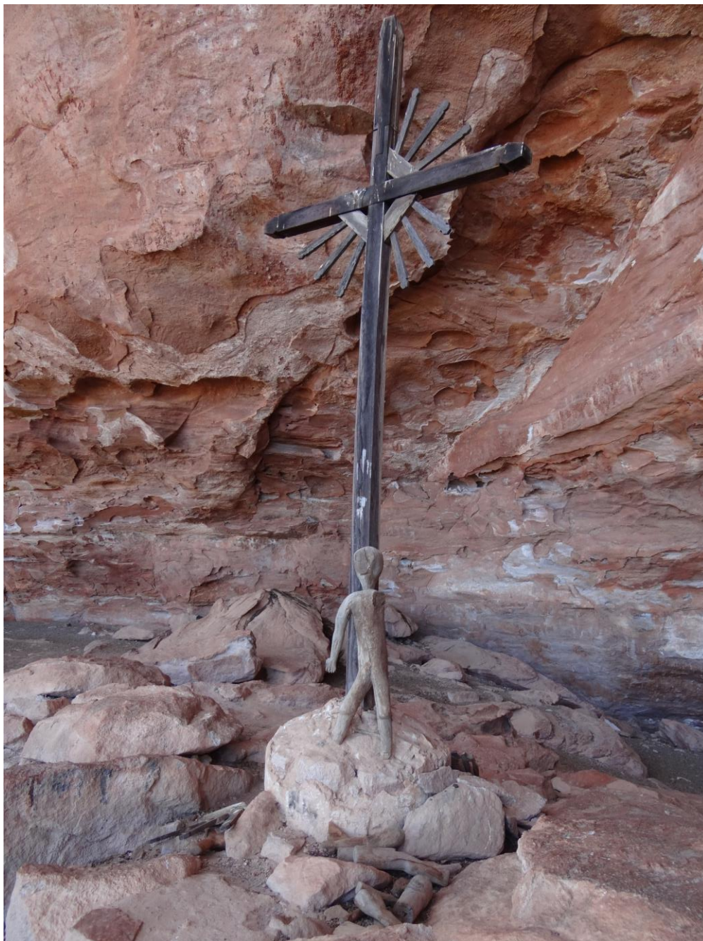
Figura 15. Primeiro ex-voto, a Cruz.