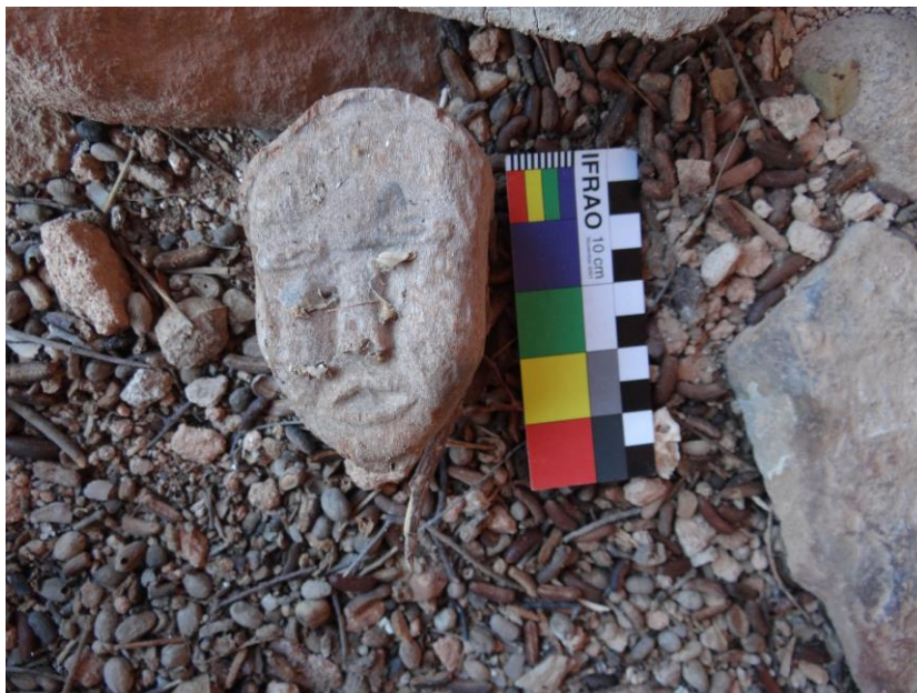
Figura 12. Cabeça sem pescoço, com boca, nariz, olhos, cabelo e orelhas em alto relevo.