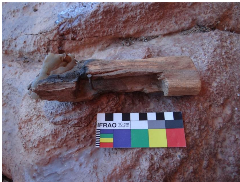
Figura 18. Fragmento com marcas de queima e com vestígios de cera de vela.

Entre os objetos fragmentados, há duas peças com partes queimadas, sendo que uma delas estava no local onde os fiéis acendiam as velas durante as orações, e no outro fragmento havia vestígios de cera (Figura 18), o que pode indicar uma queima acidental.