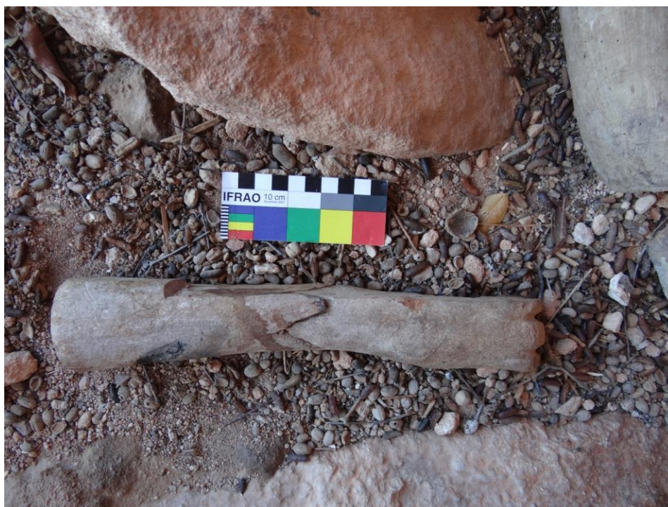
Figura 8. Mão 2, com antebraço. Fonte: (SOUSA, 2019, p. 53).

Mão 2: Escultura entalhada do antebraço e mão (Figura 08), tem 29 cm de comprimento por aproximadamente 13,5 cm de espessura e um dos dedos está quebrado. Podemos observar pouca riqueza de detalhes e ausência de marcas de lixamento ou polimento, não sendo uma peça que prime por uma representação naturalista. Esse exvoto possui uma avaria, tendo sido encontrado fendido em duas partes. A madeira empregada na confecção da escultura foi a Amburana.