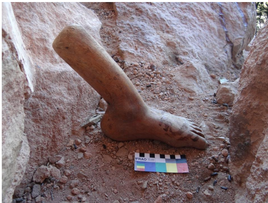
Figura 04. Pé 3, com tornozelo, parte da perna e dedos. Fonte: (SOUSA, 2019, p. 50).

Pé 3: Escultura do pé, tornozelo e parte da perna (Figuras 04 e 05). O pé possui 21 cm de comprimento por 6,5 cm de espessura, a altura do pé até a perna é de 24 cm. É um ex-voto que foi entalhado e polido, apresentando detalhes pintados (unhas) e acabamento com verniz. Dentre todas as esculturas de membros inferiores, essa é a que apresenta uma maior fidelidade e proporcionalidade à anatomia humana, evidenciando tratar-se do trabalho de um escultor experiente. O tipo de madeira empregado na escultura foi a Amburana.