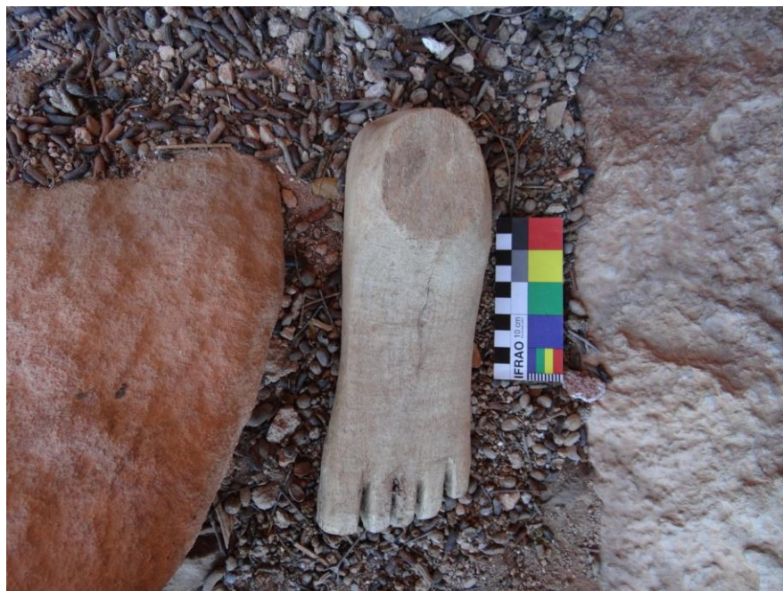
Figura 03. Pé 2, com tornozelo e dedos com detalhes anatômicos. Fonte: (SOUSA, 2019, p. 49).

Pé 2: Escultura de pé com o tornozelo (Figura 03). O pé possui 23,5 cm de comprimento por 7 cm de espessura; e, do tornozelo à sola do pé, a altura é de 8 cm. A madeira utilizada foi a Amburana; o entalhe foi a técnica empregada para a formatação geral da peça e representação dos detalhes anatômicos (dedos), sendo que o lixamento não foi aplicado exclusivamente na área que representa a parte inferior do pé (sola).