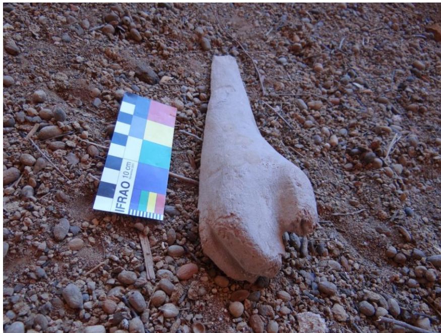
Figura 09. Mão 3, representação de mão e punho.

Mão 3: Escultura entalhada do punho e mão (Figura 09), tem 21 cm de comprimento por 6 cm de espessura. Observa-se que a peça está em parte quebrada, possuindo apenas três dedos; mas, apesar de estar danificada, reconhece-se que a mão foi representada fechada. O tipo de madeira utilizada para a confecção do ex-voto foi a Amburana, e observam-se indícios de lixamento no acabamento da peça.