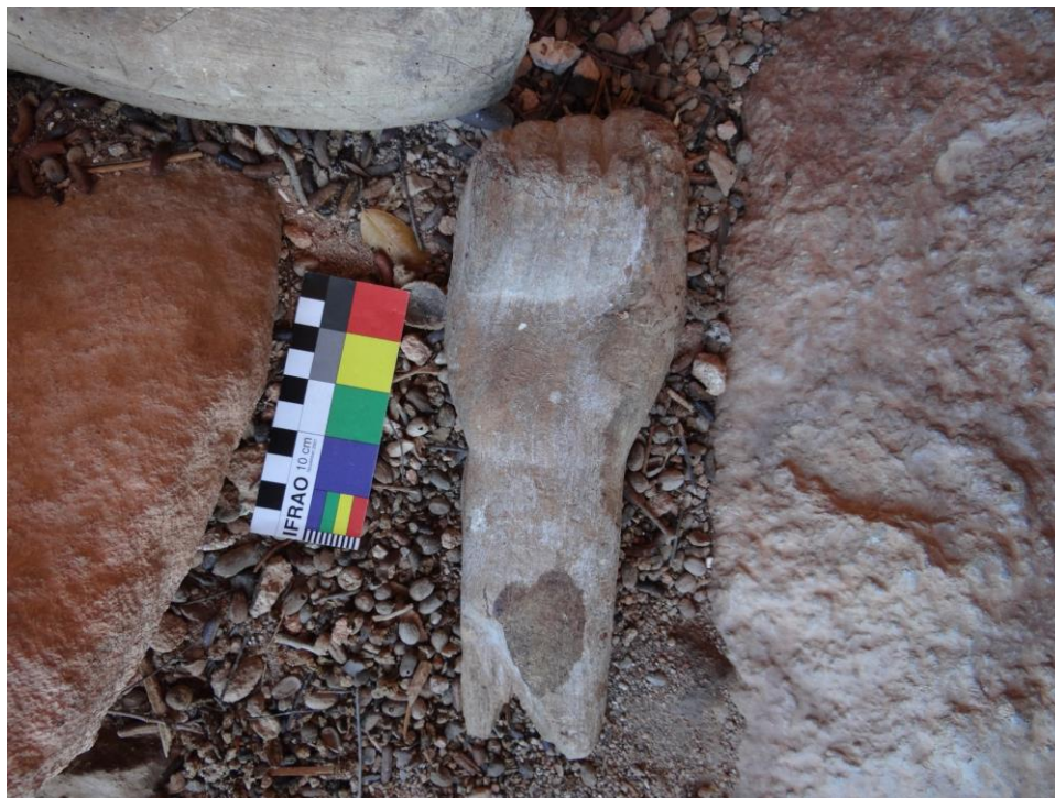
Figura 07. Mão 1, representação de punho fechado.

Mão 2: Escultura entalhada do antebraço e mão (Figura 08), tem 29 cm de comprimento por aproximadamente 13,5 cm de espessura e um dos dedos está quebrado. Podemos observar pouca riqueza de detalhes e ausência de marcas de lixamento ou polimento, não sendo uma peça que prime por uma representação naturalista. Esse exvoto possui uma avaria, tendo sido encontrado fendido em duas partes. A madeira empregada na confecção da escultura foi a Amburana.