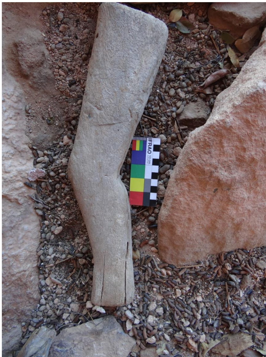
Figura 06. Ex-voto representando uma perna. Fonte: (SOUSA, 2019, p. 51).

Perna: Escultura entalhada e lixada de uma perna sem o pé (Figura 06). Provavelmente se iniciava no tornozelo, não há como ter certeza porque está com essa parte quebrada; são 20,5 cm de comprimento do joelho até a coxa e, da coxa até a panturrilha, são 19 cm de comprimento. O tipo de madeira utilizada foi a Amburana.