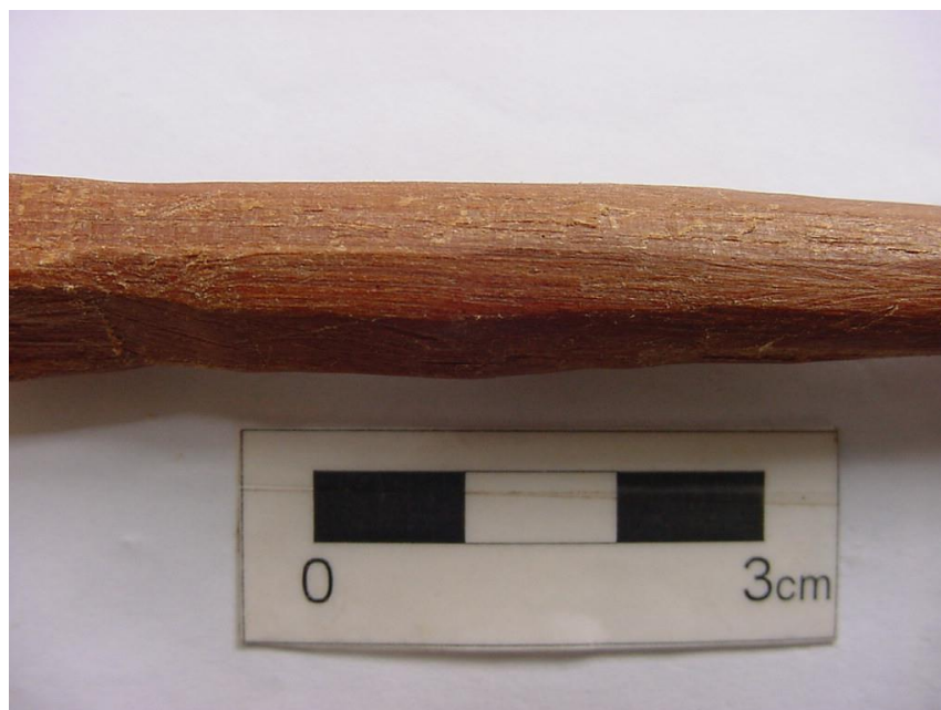
Foto 9. Detalhe de haste de madeira facetada, calibrada com concha de gastrópode terrestre.