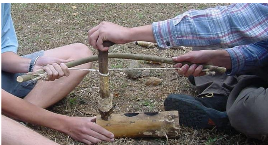
Foto 4. Perfuração rotativa com broca de ponta de pedra, utilizando o arco, duas pessoas e pedra de apoio.