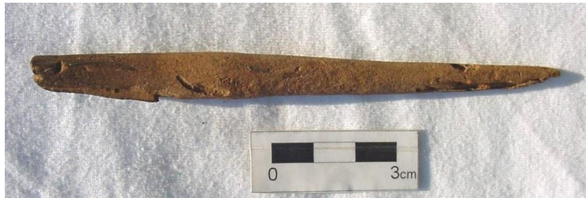
Foto 7. Ponta de madeira encontrada na Lapa do Dragão.