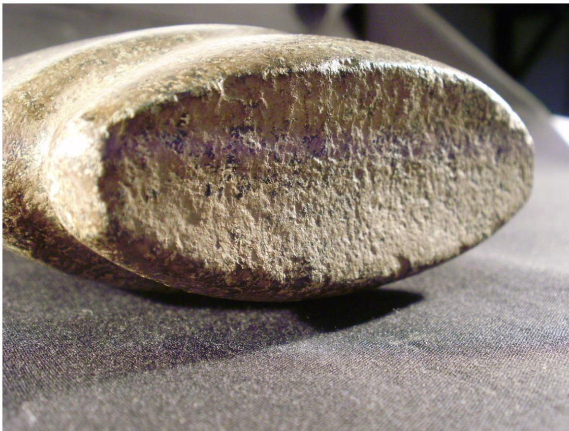
Foto 12. Talão de lâmina de pedra polida com canaleta que acompanha seu comprimento.

impressões do trançado no material adesivo podem fornecer dados importantes para a reconstituição do material perecível, inclusive.