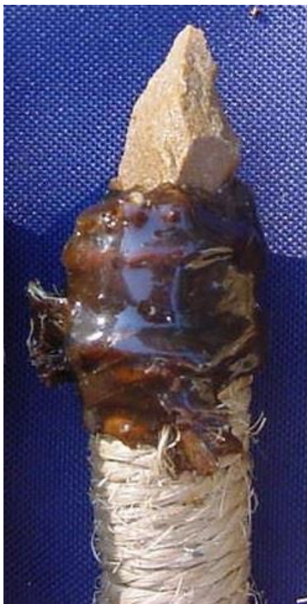
Foto 3. Aspecto estético do encabamento de uma ponta de broca com corda, cera de abelha e resina de jatobá.

preserva. Este pode ser, também, um dos potenciais usos de depressões circulares polidas presentes, não raro, nas faces de algumas lâminas de pedra polida. De fato, a forma mais eficiente e confortável de utilização do material, que com os peregíveis e rochas construímos, foi através do auxílio de uma segunda pessoa, algo que tampouco havia sido cogitado na montagem dos experimentos (Foto 4), ainda que uma adequação de postura e de prensão com os pés, dentre outras coisas, pudesse tornar o trabalho perfeitamente possível de ser conduzido por uma pessoa.