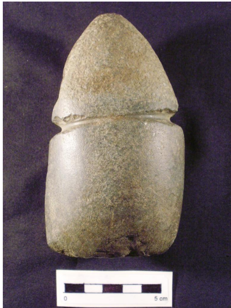
Foto 13. Lâmina de pedra polida com sulco que apresenta fino polimento brilhante em seu interior.

Análises tecnológicas permitem igualmente relacionar o material lítico a outras cadeias operatórias que incluem material perecível. Um caso particularmente interessante surgiu a partir da análise de uma lâmina de pedra polida coletada durante a escavação do sítio Vereda III (RODRIGUES e GARDIMAN, 2016), sítio repleto de cerâmicas afiliadas à Tradição Aratu. A lâmina apresentava uma série de características interessantes, indicativas de usos diversificados, potencialmente relacionados à história de vida do artefato que teria sido iniciada como lâmina de pedra polida (talvez um machado), mas que teria também circulado com outras formas de uso, sobretudo levando-se em consideração o fato de o gume dessa lâmina encontrar-se quebrado (Foto 14) e de ela apresentar diferenças de pátina em suas superfícies, indicando outros usos em momentos distintos. Além de uma pequena depressão na parte mesial em uma das faces, cujas características sugerem o uso como bigorna para processamento de vegetais (“quebra-cocos”), a peça apresentava facetas muito peculiares no talão (ambas também visíveis na Foto 14). Essas facetas eram formadas por golpes leves, repetidos e com pouca amplitude de movimento, com eventual arrasto, relacionadas certamente ao impacto que envolveria processamento de material não mineral (se o impacto se desse apenas sobre material rochoso, os vestígios seriam mais robustos e mais facilmente identificáveis).