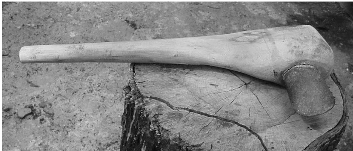
Foto 11. Lâmina de pedra polida com encabamento de tipo embutido.

exemplares arqueológicos preservados com esse mesmo tipo de encabamento, como no Museu Paranaense, em Curitiba-SC e no Museu Paraense Emílio Goeldi (MPOG), em Belém-PA, indicando uma recorrência e ampla distribuição territorial desse tipo, o que implica a possibilidade de expandido potencial explicativo das constatações a ele relacionadas.