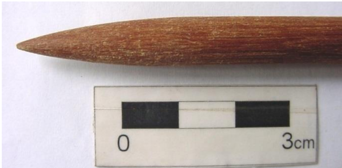
Foto 10. Ponta de madeira calibrada com calibrador de cerâmica.

Além do processo de raspagem, com o objetivo de produzir uma regularização mais fina, utilizamos as hastes sobre calibradores, sendo estes constituídos sobre diferentes rochas ou sobre fragmentos de cerâmica, com pastas diferentes e antiplásticos de diferentes granulometrias. O que nos parece mais relevante diante da temática do presente artigo, no entanto, diz respeito à ação sobre a matéria perecível, que seria, novamente, a haste de paraju. De fato utilizamos outras madeiras, mais duras, que apresentaram rendimento um pouco mais lento, embora tenham por vezes apresentado também um tratamento de superfície mais fino. Apesar disso, o aspecto deixado nas hastes foi bastante satisfatório, demonstrando ser possível produzir hastes bastante regulares, tanto em termos de tratamento de superfície quanto no aspecto geral e da secção, conferindo à haste, inicialmente facetada e torta, um perfil retilíneo e uma secção circular, características essas conseguidas com um trabalho de 60 minutos sobre um calibrador de cerâmica. Além disso, as mesmas canaletas que serviram para a regularização das hastes permitiram a produção de uma ponta de morfologia ogival bastante regular (Foto 10), conseguida com um trabalho mais delicado e cuidadoso, que durou outros 40 minutos. Com o endurecimento pelo fogo, essa ponta estaria plenamente funcional na extremidade de um dardo ou flecha.