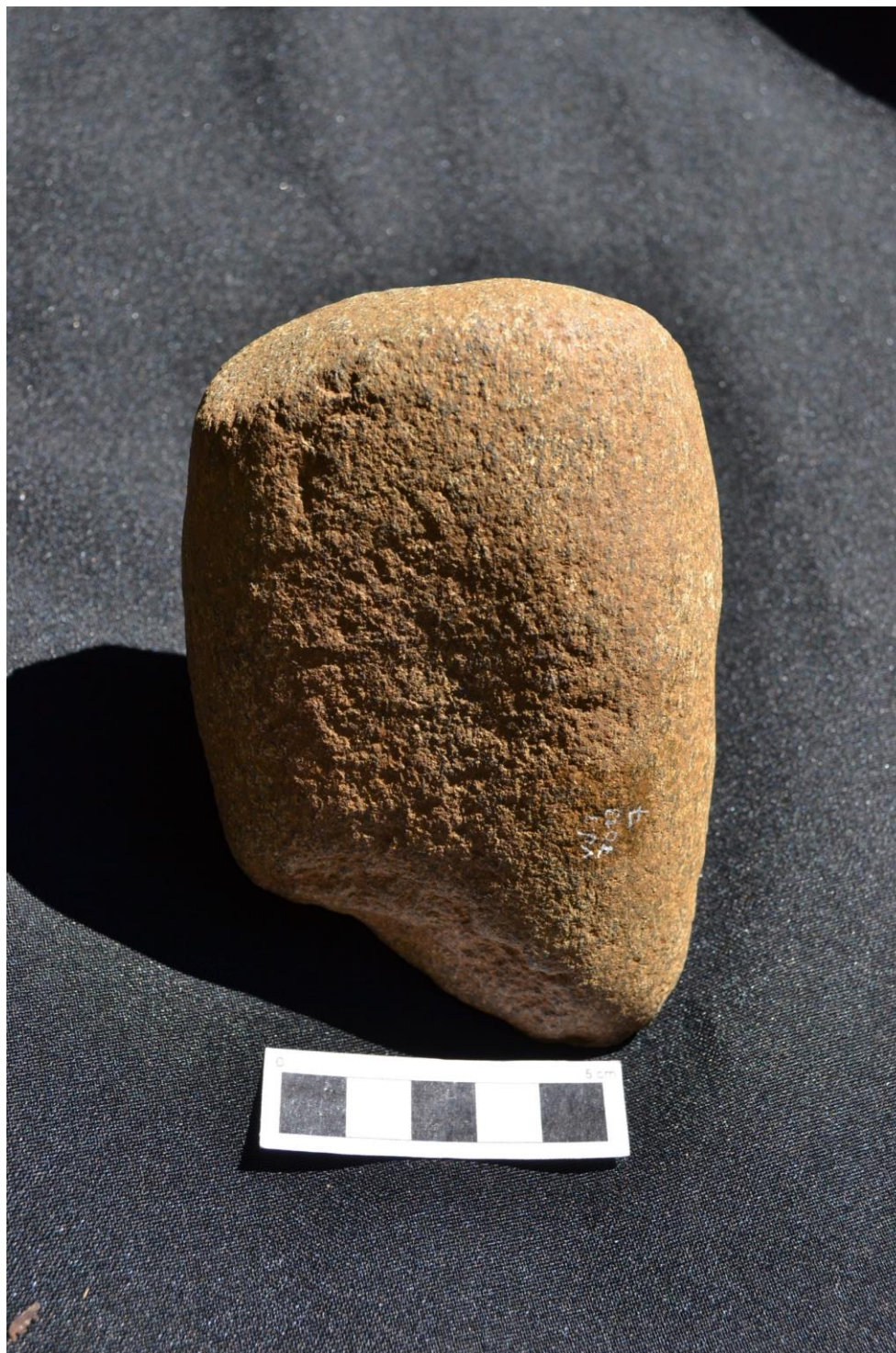
Foto 14. Lâmina de pedra polida com gume quebrado (parte de baixo), depressão central (vestígios uso como bigorna) e facetas no talão (parte superior) também indicativas de uso.

milho, por exemplo. De forma reveladora, posteriores análises microscópicas da lâmina (GARDIMAN, 2014) vieram a corroborar essa interpretação, uma vez que identificaram grãos de amido presos aos microporos da pequena concavidade, indicando o contato com milho ( Zea mays sp ); e nos microporos das facetas do talão, indicando o contato não apenas com grãos do milho, mas também com batata-doce ( Ipoema batatas ), sugerindo fortemente que a lâmina de fato fora utilizada no processamento de vegetais, como a análise tecnológica havia sugerido.