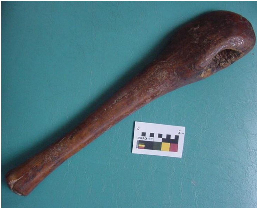
Foto 1. Cabo de madeira para machado de pedra encontrado na Lapa do Boquete.

A forma de preensão igualmente foi direcionada por material perecível preservado. No caso, nos referimos a um sepultamento da Lapa do Boquete, em que parte do enxoval funerário do Sepultamento IV (excepcionalmente preservado por mumificação natural) parecia integrar uma espécie de estojo para o encabamento de lâminas polidas. O referido estojo incluía fibras de entrecasca e uma bola de cera de abelha, material esse que potencialmente não teve a mesma sorte do cabo e, portanto, deve ter sido impactado pelo incêndio.