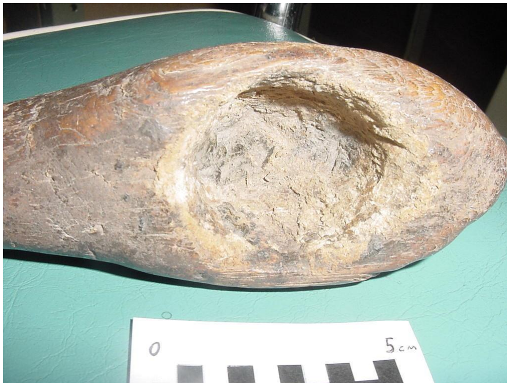
Foto 5. Detalhes do nicho do cabo de madeira encontrado na Lapa da Boquete, apresentando vestígios coincidentes com os de trabalho com cinzel de osso.

De fato, nossa relativa pouca atenção dada ao mundo orgânico, que certamente permeava a vida dessas pessoas, nos prega peças. Ainda na perspectiva de compreender melhor a diversidade envolvida no encabamento de uma lâmina de pedra polida como machado, dedicamo-nos a produzir um outro tipo bastante peculiar de encabamento, o dito orgânico, que consiste na inserção de uma lâmina em uma concavidade escavada em uma árvore ainda viva (SOUZA e LIMA, 2014). A árvore em questão era uma goiabeira ( Psidium guajava ), em cujo orifício inserimos a lâmina. Foram necessários 10 meses, com checagem periódica, para que a lâmina estivesse firmemente presa ao galho, de modo que este pudesse ser removido e o cabo pudesse ser finalizado. Após a remoção do galho, com a utilização de um machado de pedra, resolvemos dar início à retirada da parte externa da madeira com o auxílio de um raspador côncavo, lascado em arenito silicificado. Observamos que o instrumento era bastante eficiente, permitindo retirar grande quantidade de matéria (Foto 6) em apenas 5 minutos de trabalho. Decidimos, então, reservar o cabo para testar a eficiência com a madeira já seca. Poucos meses depois, com a madeira bem seca, quando decidimos retomar o trabalho, fomos surpreendidos com o fato de o tronco ter se tornado de tal forma duro, que o artefato não era mais capaz sequer de penetrar entre as fibras. Na ausência de instrumentos mais robustos de trabalho, tivemos que abandonar a finalização do cabo.