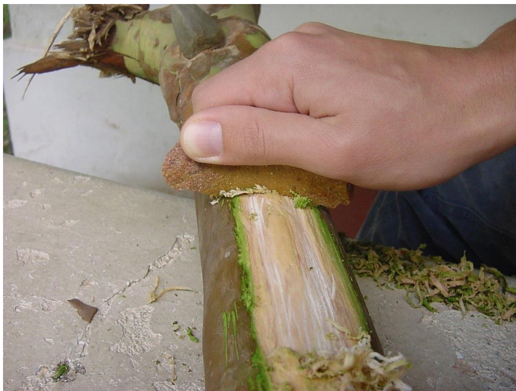
Foto 6. Raspador côncavo removendo casca de árvore verde para formatação de cabo.

muito provavelmente ocorreria com a madeira ainda verde, logo após a sua retirada da árvore, uma vez que isso economizaria muita energia no processo de formatação.