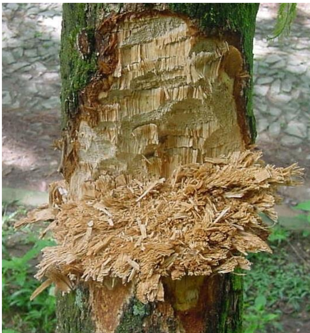
Foto 2. Talho em tronco de madeira feito com machado de pedra. Notar perfil das lascas de madeira.

Isso gera um esmagamento das fibras que constituem o tronco na parte de baixo do talho. Essas fibras esmagadas podem ser retiradas de tempos em tempos com golpes perpendiculares, limpando o talho para o trabalho, produzindo assim achas com perfil reto-esmagado. Isso significa dizer que essas achas (ou lascas de madeira) se apresentariam com sua parte superior esmagada pelo golpe lateral do gume de pedra que escorrega sobre o talho. A parte inferior da acha, por sua vez, se apresentaria reta, cortada pelo golpe perpendicular ao sentido do tronco. Os negativos dos golpes são também bastante nítidos, permitindo, quiçá, a reconstituição da sequência dos golpes em um tronco. Essas características peculiares de um tronco cortado por lâmina de pedra foram observadas pelo colega arqueólogo Ângelo Pessoa Lima 2 quando em prospecção em uma região da Serra do Ramalho-BA.