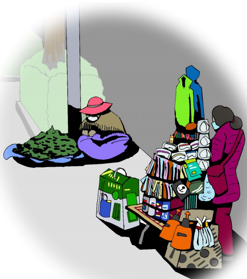
Figura 4. Caseras de hierbas medicinales e insumos anti-COVID. Avenida Arce, octubre de 2020 (elaboración propia).