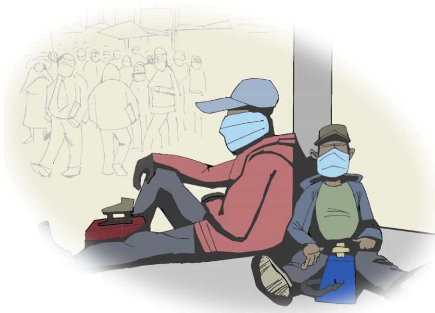
Figura 3. Lustrabotas entre rostros ocultos. Atrio de San Francisco, agosto del 2020 (elaboración propia).

La pandemia obligó a pequeños comerciantes y transportistas a cambiar creativamente las formas materiales de su interacción con los clientes, suspendidos entre la enfermedad y la pobreza. Cada tienda ubicó al menos una bandeja con agua enjabonada a la entrada. Las vendedoras de las tiendas de barrio atendieron a través de rejillas entreabiertas. Los conductores colocaron barreras de plástico entre ellos y sus pasajeros, con ingeniosos dispositivos para cobrar los pasajes. En las latas de comida sobre ruedas, los cocineros se encerraron, con sus hamburguesas y salchipapas, tras transparentes cortinas. Hasta la señora que vende pasteles sobre una acera de la avenida Arce se hizo una carpita plástica que también la protege de la lluvia. Acrílico y alcohol son las nuevas texturas y aromas de la experiencia urbana, compartiendo escena con los cables colgantes, el griterío, las bocinas, las fachadas republicanas, los neones, el pollo frito, el sol, el vapor, el humo.