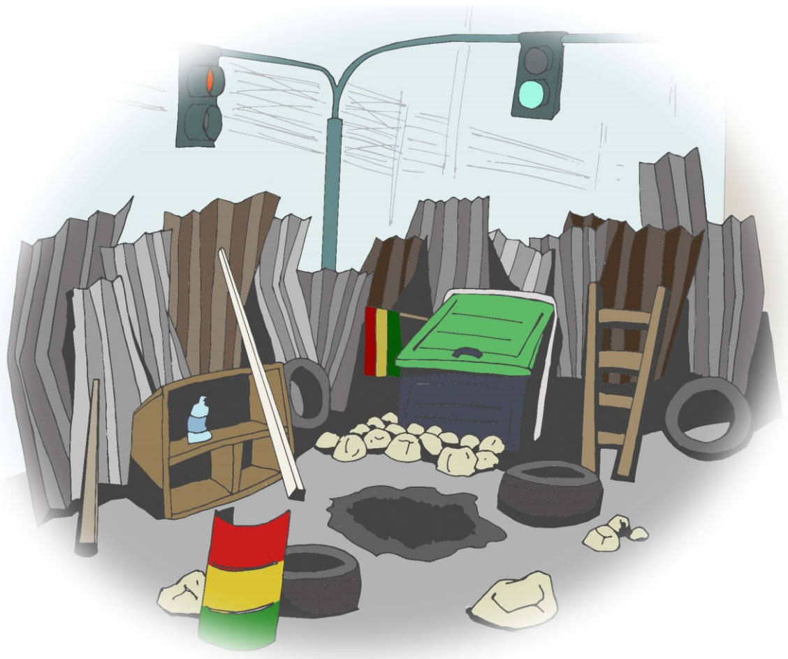
Figura 1. Una barricada fría. Esquina de las calles Indaburo y Colón el 12 de noviembre de 2019.

país en equilibrio durante los meses restantes. Las esperanzas desaparecieron en enero, cuando la presidenta demostró su hambre de poder presentándose como candidata (EFE, 2020).