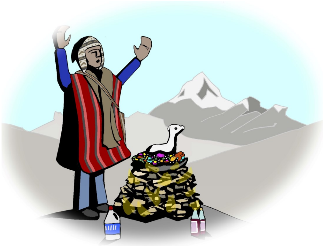
Figura 5. Despachando al coronavirus en La Cumbre en agosto, mes de la Pachamama, 2020 (elaboración propia).