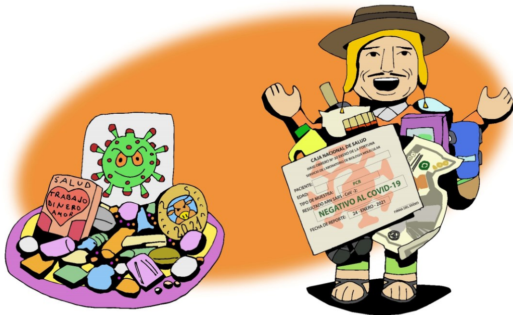
Figura 7. Mesa de Año Nuevo y Ekeko con certificado de COVID negativo en Alasitas. Diciembre de 2020 - enero de 2021 (elaboración propia).